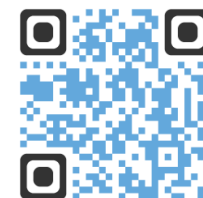
SITE DE LYON

VISITE VIRTUELLE DES ÉTABLISSEMENTS DE LADAPT RHÔNE-MÉTROPOLE DE LYON :