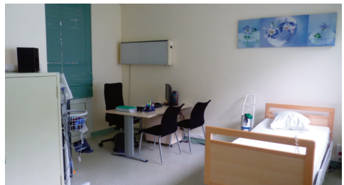
Salle de consultation.