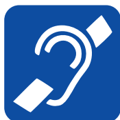
DIFFICULTÉS DE COMPRÉHENSION